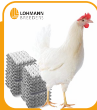
Love Farms / JK Breeders